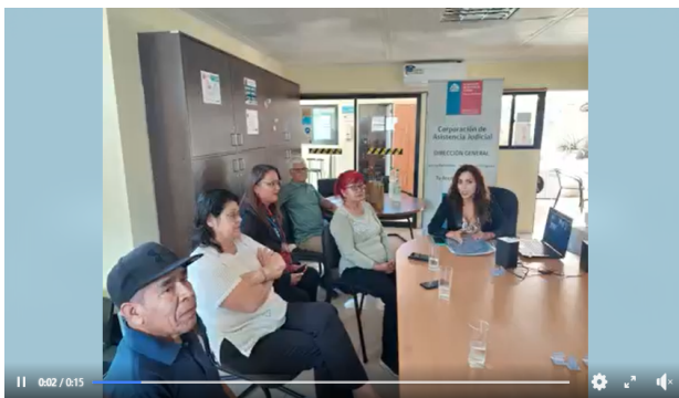
#TuAccesoALaJusticia #AricayParinacota #Tarapacá #Antofagasta El Consejo para la Sociedad Civil, COSOC, de la CAJTA celebró su primera sesión del año...